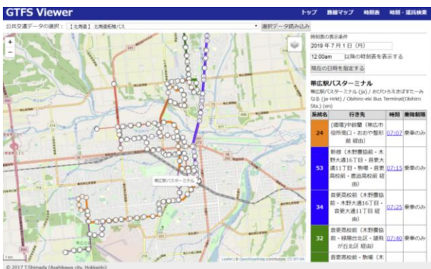
図 1 GTFS Viewer

上記の研究開発の基礎として、データベースによるデータの処理と管理、データ統合についての研究を行っています。