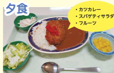
・カツカレー ・スパゲティサラダ ・フルーツ