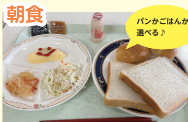
パンかごはんか 選べる♪