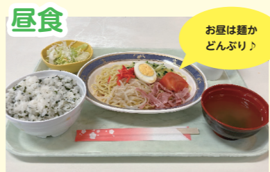
お昼は麺か どんぶり♪