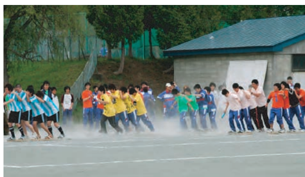
▲校内体育大会(平成21年度)▲