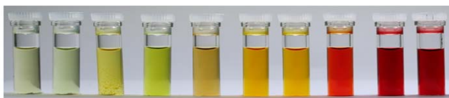
Blank ClO 4 - I - HSO 4 - F - NO 3 - N 3 - Br - Cl - CH 3 CO 2 -

ロイシン由来ウレア基を有するポリフェニルアセチレンのアニオン捕捉に基づく劇的な色調変化。アニオン種を目視でセンシングできる。