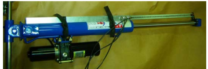
電動シリンダに取付けた状態